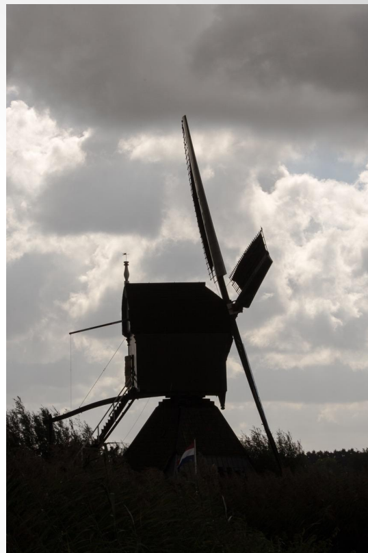
Twee foto's van Frank gemaakt tijdens de verkenning